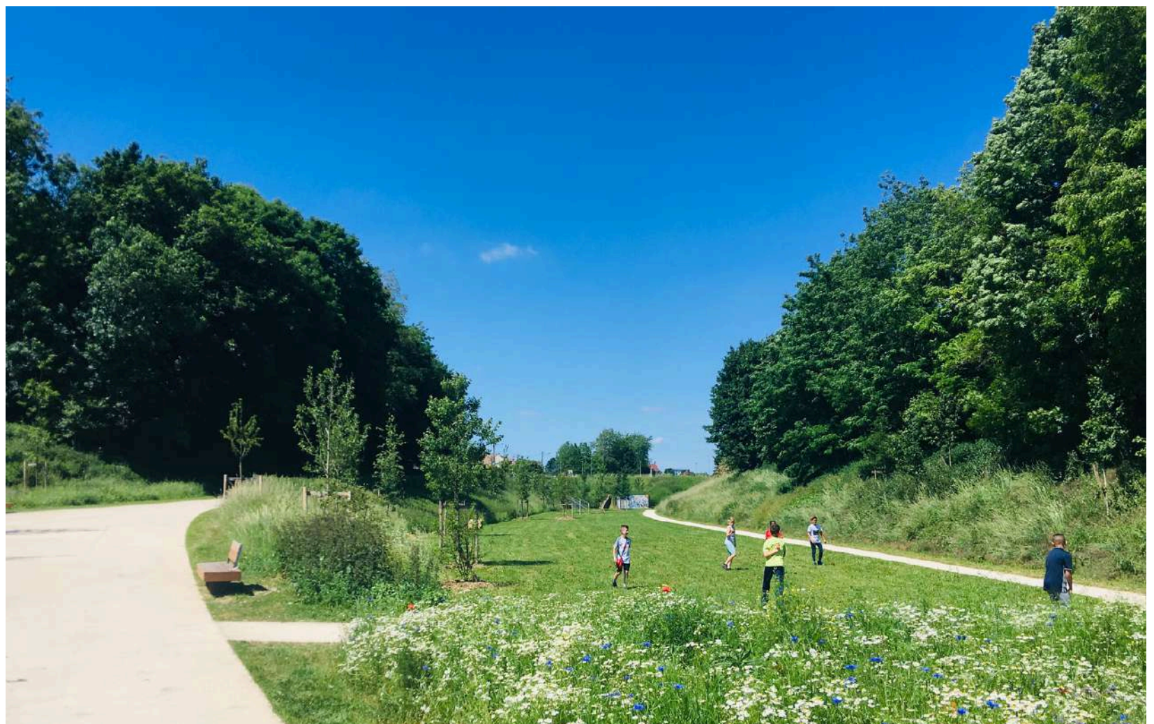
Avenue Foreau_Villecresnes_©SMER la Végétale