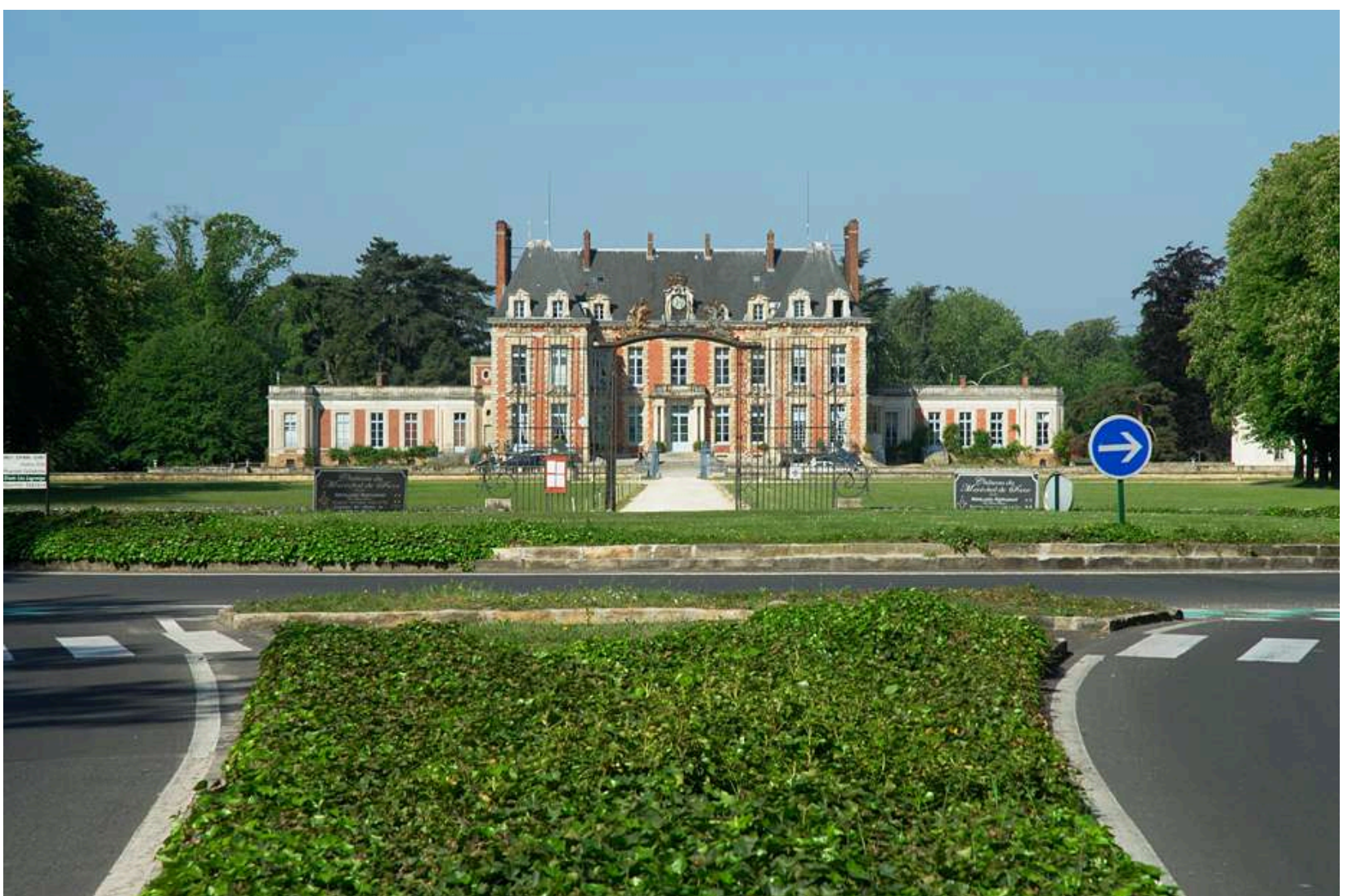
Château du Maréchal de Saxe