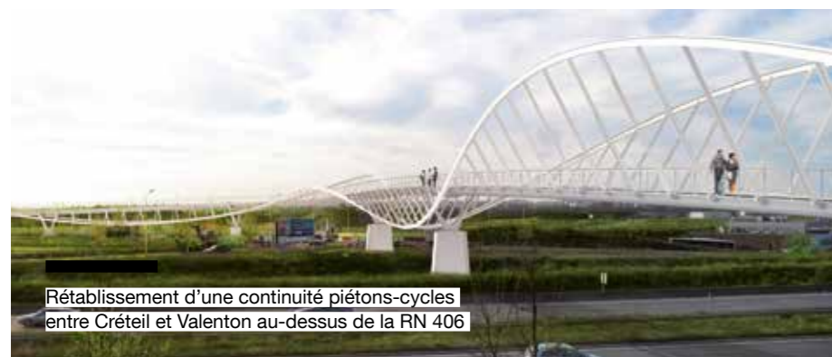
Rétablissement d'une continuité piétons-cycles entre Créteil et Valenton au-dessus de la RN 406