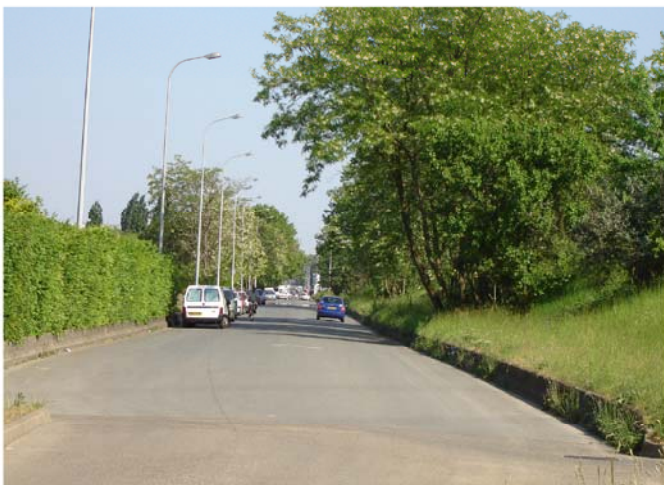
Avant les travaux, la voie de la Pompadour formait une coupure entre l'île de loisirs et le périmètre de la Tégéval, dont la végétation était peu préservée.