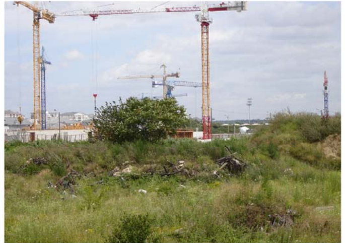
Extension de l'urbanisation de Créteil à proximité du lac