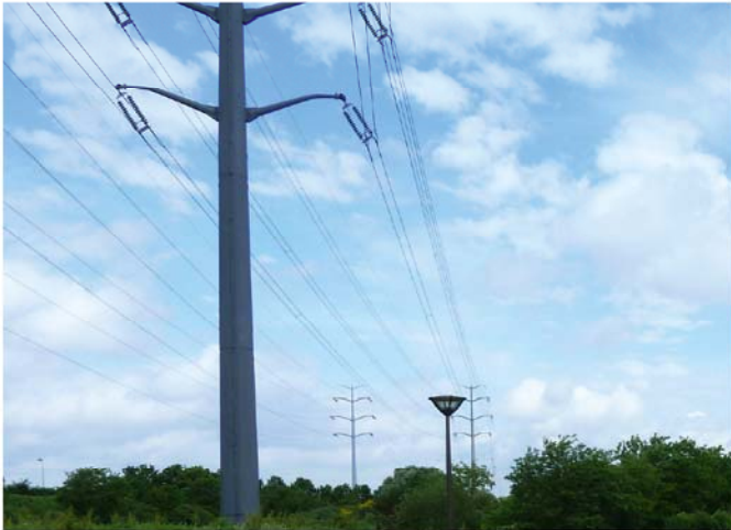
Pyônes EDF traversant le site