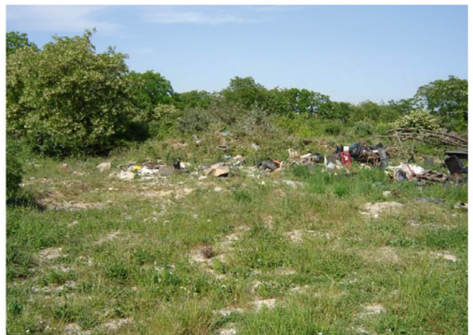
Dépôts sauvages sur le site